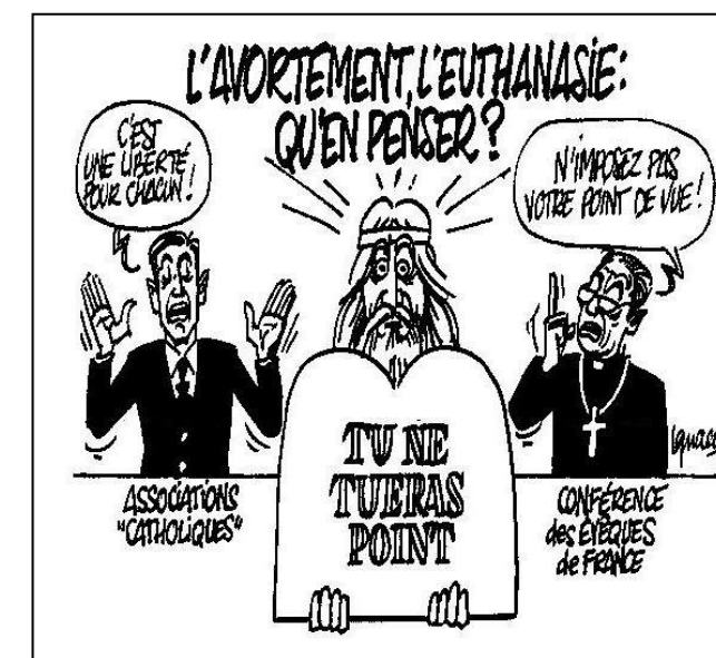
- Une illustration du libéralisme en morale -

[D'après « le mot du Prieur » - Prieuré ND du Pointet, 4ème trimestre 2018]