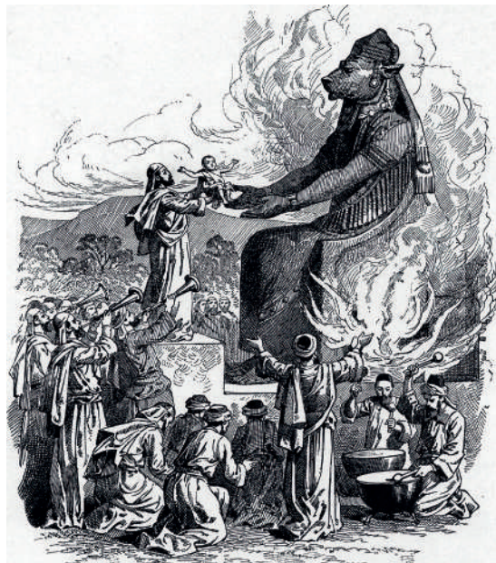
Offrande à Moloch, faux dieu des Cananéens connu pour les sacrifices d'enfants qu'on lui offrait (Charles Foster, 1897)

créées par les hommes. Cependant dans ces révolutions destructrices de l'ordre et des autorités légitimes, qui étaient comme des révoltes plus ou moins explicites contre la loi de Dieu, le sang versé n'était pas à la base du mouvement révolutionnaire. Il en était plutôt une conséquence indispensable, afin que ce mouvement réussisse.