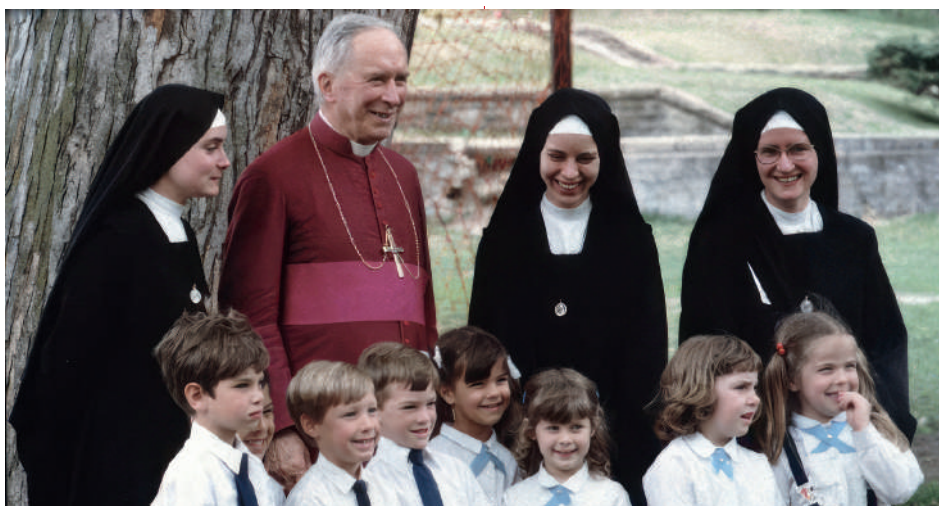
Monseigneur Lefebvre et les Sœurs de la Fraternité Saint-Pie X

Enfin, toujours dans les Constitutions de la congrégation des Sœurs de la Fraternité Saint-Pie X, il est écrit :